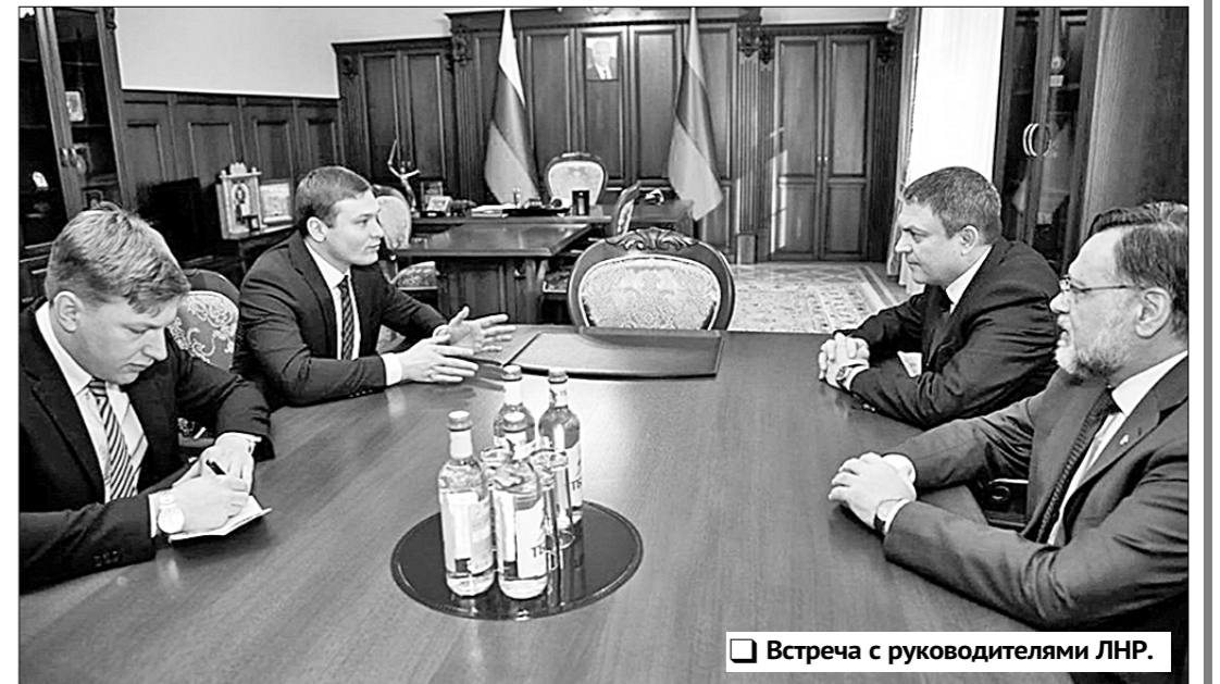
Встреча с руководителями ЛНР.