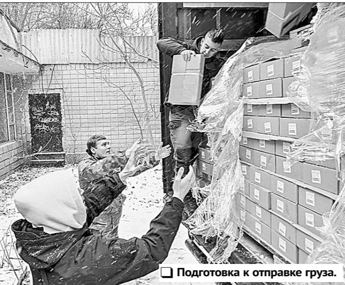
Подготовка к отправке груза.