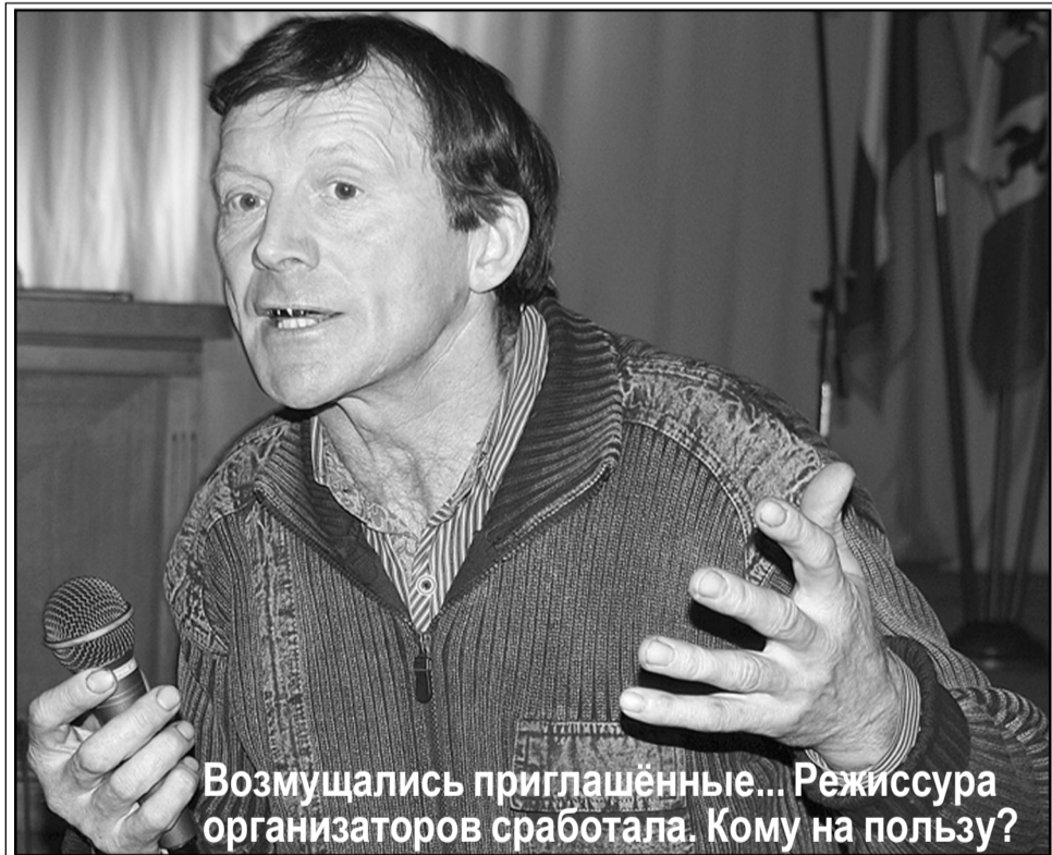
Возмутились приглашённые... Режиссура организаторов сработала. Кому на пользу?

Я удивляюсь как работают депутаты. Какая может быть политика в районе? Роль депутатов помогать решать проблемы. Я целый год молчал, как и другие, молча поддерживал руководителя района. Образовались две группы депутатов: молчаливые и активные. Но создалась такая ситуация, что даже не приятно, группа депутатов настроена на то, чтобы глава подал в отставку. Другого ответа такой активности я не