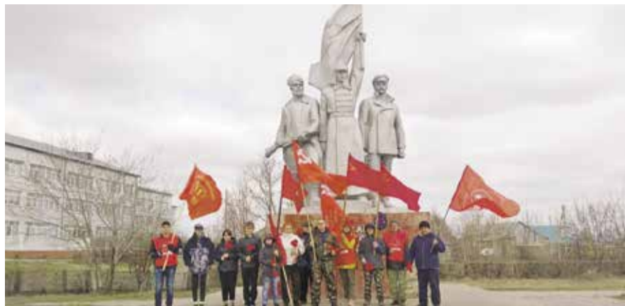
НА ФОТО: КОММУНИСТЫ БАРАБИНСКА НА ПЕРВОМАЙСКОЙ ДЕМОНСТРАЦИИ

вые коллективы были в советский период — тогда Первомай был поводом прославить их достижения. Отмечен и международный аспект праздника — солидарность, коммунисты приняли резолюцию о поддержке специальной военной операции, в которой осудили агрессивные планы блока НАТО.