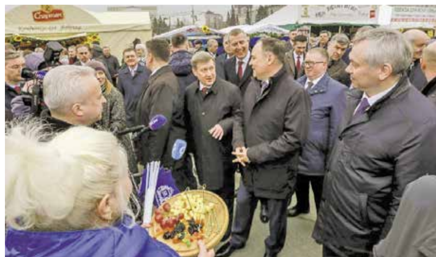
НА ФОТО: ПЕРВЫЙ СЕКРЕТАРЬ НОВОСИБИРСКОГО ОБКОМА КПКРФ, МЭР НОВОСИБИРСКА АНАТОЛИЙ ЛОКОТЬ И ПРЕМЬЕР-МИНИСТР РЕСПУБЛИКИ БЕЛАРУСЬ РОМАН ГОЛОВЧЕНКО

Мероприятием, наглядно показавшим, что у нас общая история, стало совместное возложение цве-