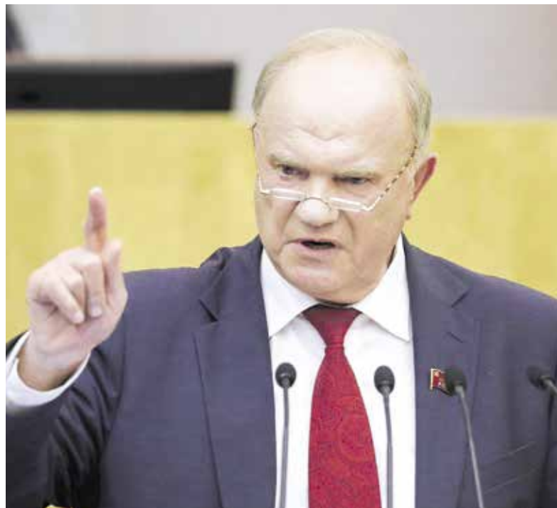
НА ФОТО: ПРЕДСЕДАТЕЛЬ ЦК КПРФ ГЕННАДИЙ ЗЮГАНОВ

Но разве мы с вами так поглупели, что поддадимся провокаторам, разжигающим вражду и ненависть? В самые тяжёлые моменты народная мудрость