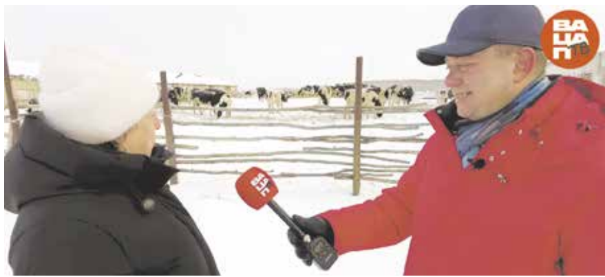
НА ФОТО: СЕЛЯН ХОТЯТ ОСТАВИТЬ БЕЗ МОЛОКА

Всегда с гордостью отмечалось, что хозяйство никогда не проходило тяжелый путь реорганизации. Но именно поэтому