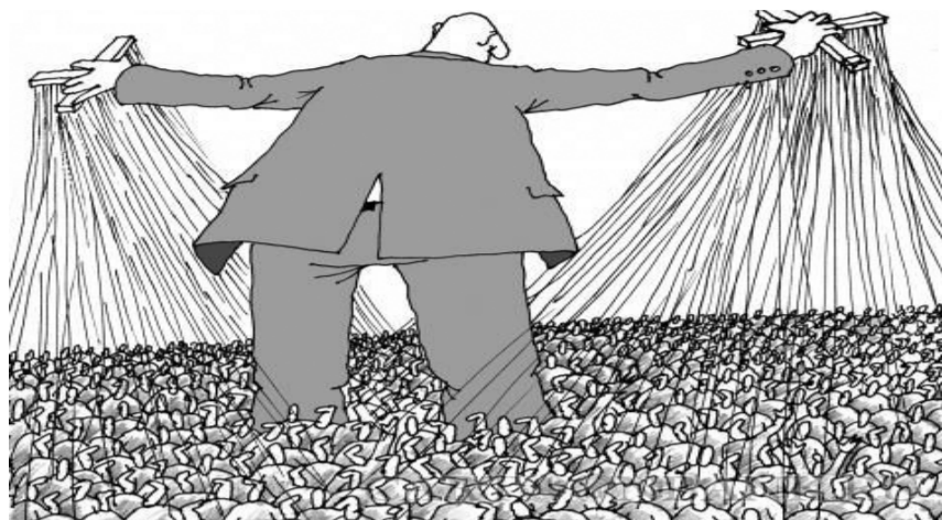
НА ФОТО: ДЕПУТАТЫ-МАРИОНЕТКИ ПЫТАЮТСЯ ВЗОРВАТЬ ПОЛИТИЧЕСКУЮ СИТУАЦИЮ В РЕГИОНЕ