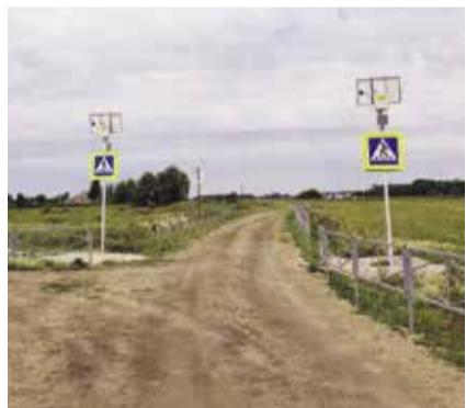
НА ФОТО: ПЕШЕХОДНЫЙ ПЕРЕХОД В ЧИСТОМ ПОЛЕ — БЮДЖЕТ ОСВОЕН

Доволенский район, которому в прошлом году исполнилось 90 лет, — район аграрный, 76% территории занимают сельхозугодья, кроме того, территория хорошо знакома любителям охоты, рыбалки и туризма. При этом рабочих рук становится все меньше — за 5 лет население сократилось почти на тысячу человек (а с 2002 года — на четверть). Доволенские коммунисты одними из первых предложили Роману ЯКОВЛЕВУ выдвинуться в Госдуму