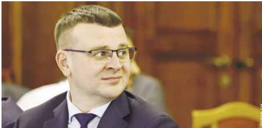
НА ФОТО: ДЕПУТАТ ЗАКОНОДАТЕЛЬНОГО СОБРАНИЯ НОВОСИБИРСКОЙ ОБЛАСТИ НИКИТА ГАЛИТАРОВ

Член строительного комитета Заксобрания Новосибирской области на очередном заседании выступил по проблеме комплексного развития территорий.