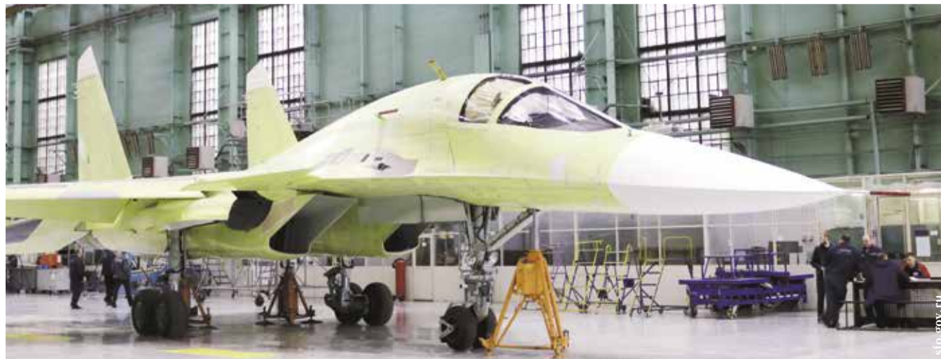
НА ФОТО: НОВОСИБИРСКИЙ ЗАВОД ИМЕНИ ЧКАЛОВА В АВАНГАРДЕ ВПК СТРАНЫ