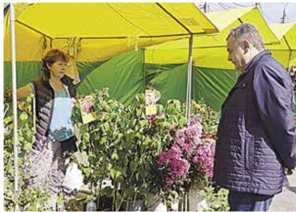
НА ФОТО: ВТОРОЙ СЕКРЕТАРЬ НОВОСИБИРСКОГО ОБЛАСТНОГО КОМИТЕТА КПРФ РЕНАТ СУЛЕЙМАНОВ НА САДОВОДСКОЙ ЯРМАРКЕ

Садоводческая ярмарка, открывшаяся на традиционном месте — возле ДК имени Чкалова, объединила более 110 организаций и частных лиц. Участников ярмарки поприветствовали лидеры КПРФ в Новосибирске — Анатолий ЛОКОТЬ и Ренат СУЛЕЙМАНОВ .