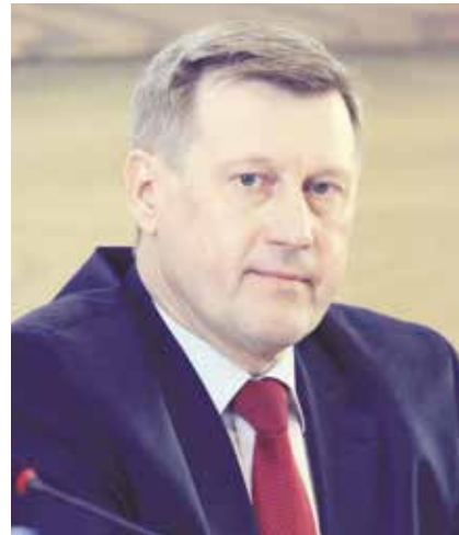
НА ФОТО: МЭР НОВОСИБИРСКА АНАТОЛИЙ ЛОКТЬ

Город Новосибирск за последние семь лет, несмотря на трудности, не остановился в своём развитии. На 97 000 человек выросла численность населения, растут объёмы промышленного производства, объёмы оптовой и розничной торговли, построено 9,5 млн кв. м метров жилья, более 70 объектов социальной инфраструктуры, включая 50 новых детских садов и 18 школ. В городе реализуют масштабные проекты благоустройства,