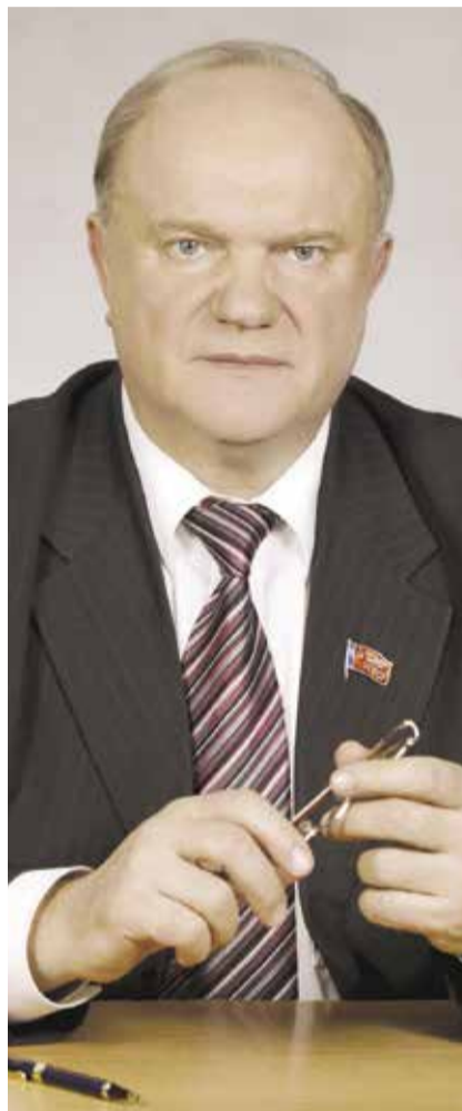
НА ФОТО: ПРЕДСЕДАТЕЛЬ ЦК КПРФ, РУКОВОДИТЕЛЬ ФРАКЦИИ КПРФ В ГОСДУМЕ ФС РФ ЗЮГАНОВ ГЕННАДИЙ АНДРЕЕВИЧ

Мы обращаемся к Евросоюзу и США с призывом осудить террор