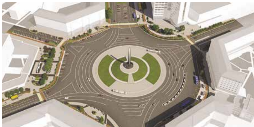
НА ФОТО: ПРОЕКТ ПЛОЩАДИ КАЛИНИНА ПОСЛЕ УСТАНОВКИ СТЕЛЫ

— С оператором у нас в сентябре прошлого года было совещание, мы получили гарантии, что до конца года