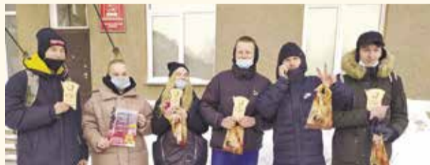
НА ФОТО: УЧАСТНИКИ МЕРОПРИЯТИЯ ПОЛУЧИЛИ ПАМЯТНЫЕ ПОДАРКИ

Новосибирские комсомольцы провели квест в честь Дня рождения Красной армии. Мероприятие состоялось 23 февраля на Монументе Славы. Четыре команды выполняли задания на смекалку, координацию и командное взаимодействие.