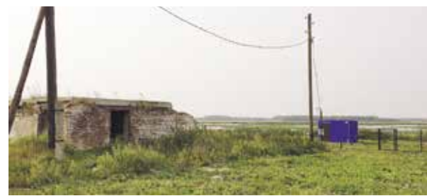
НА ФОТО: ВЛАСТИ ПРОБУРИЛИ СКВАЖИНУ ПРАКТИЧЕСКИ НА БОЛОТЕ, ОКОЛО РАЗРУШЕННОЙ БАНИ.

Как объяснили местные жители, рядом с местом, где пробурили скважину для питьевой воды, с одной стороны находится болото, с другой — ранее стояла баня с туалетом. О качестве воды при воздействии такого «соседства» можно только догадываться — рассказывают, что если ее набрать в ведро, то через некоторое время сверху появится пленка.